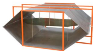
TEM 220 TEM 500